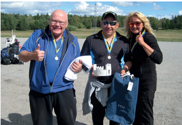
FFL boulemästare 2018

Styrelsen för Försvarets Civila Idrottsförbund lämnar härmed redogörelse över förbundets verksamhet och förvaltning under verksamhetsåret 2018.