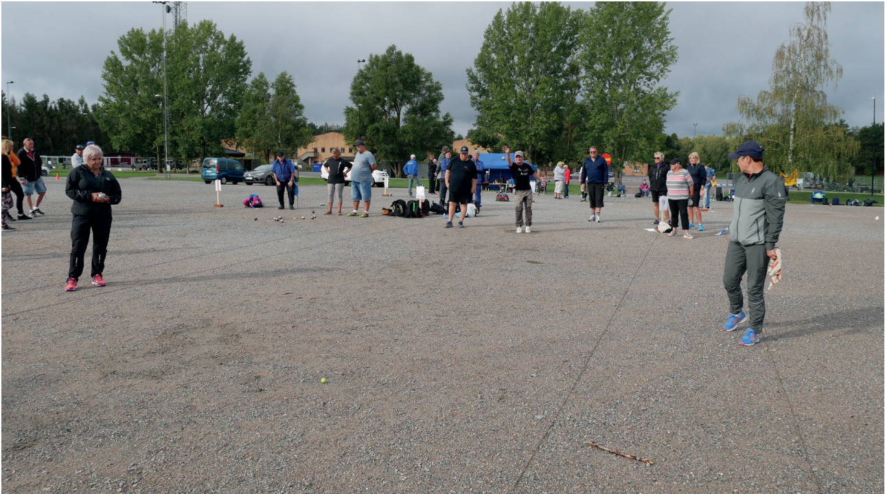
Boule i Enköping