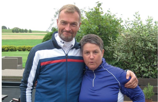
F14 CIF Mixmästare golf