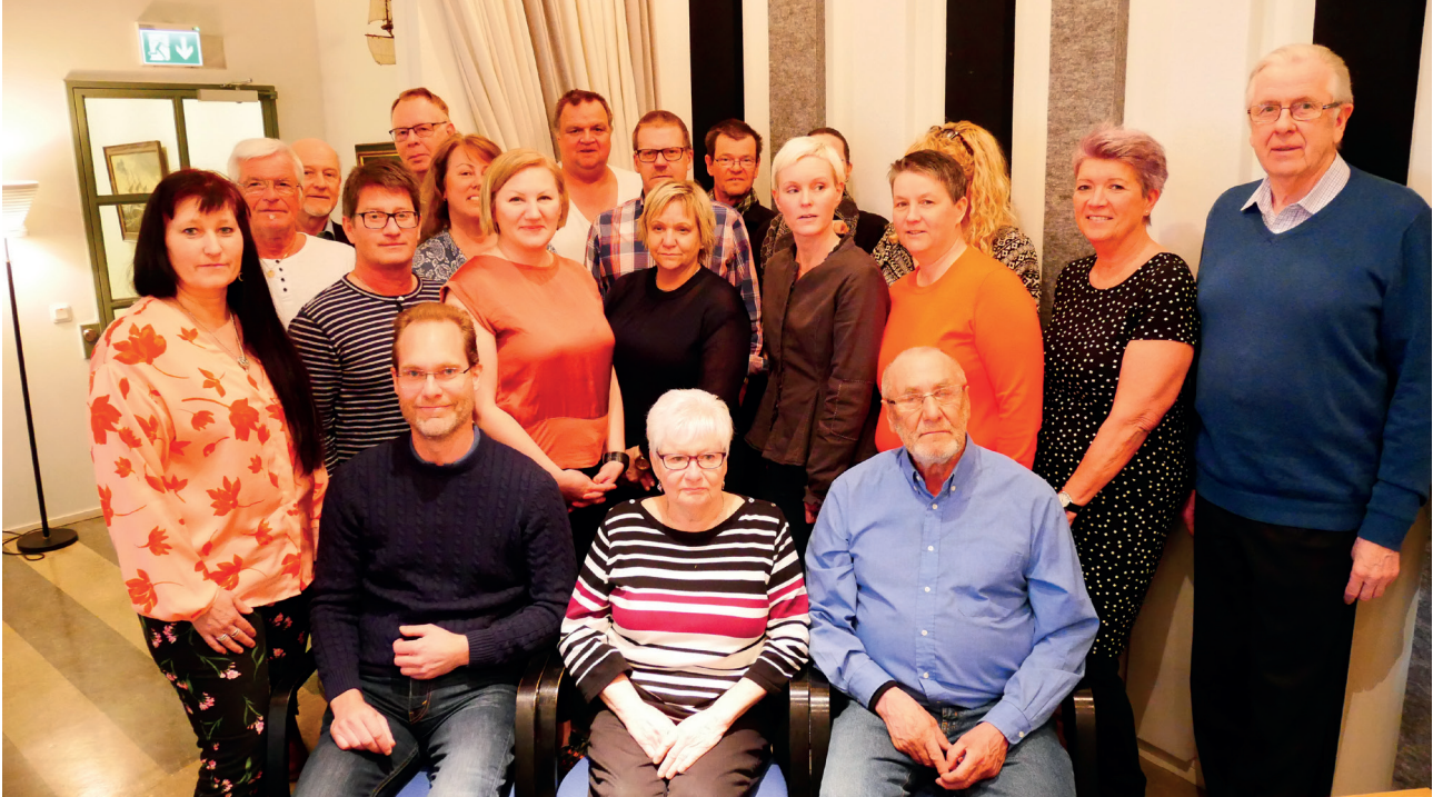
Deltagarna i förbundsmötet 2018